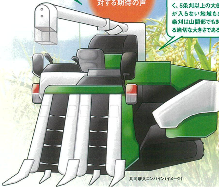
共同購入コンバイン(イメージ)

A JAグループで生産者の需要をとりまとめ、全農が生産者の代理人として一括発注・仕入をおこなうことで、製造・流通の効率化をはかり、生産者へ価格メリットを還元する取り組みです。共同購入型式として選定された機械はどなたでも購入いただけます。